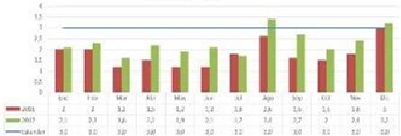
OPORTUNIDAD DE MEDICINA GENERAL 2016 Vs 2017