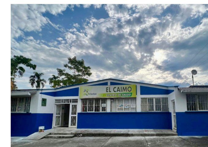
Centro de Salud El Caimo