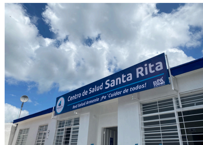
Centro de Salud Santa Rita