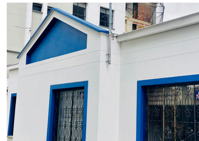
Centro de Salud Fundadores