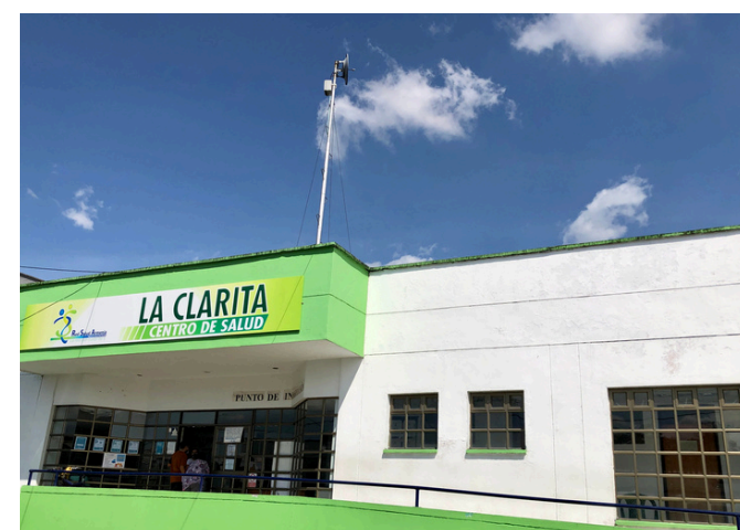
Centro de Salud La Clarita