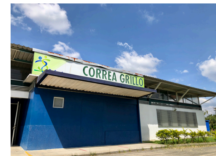
Centro de Salud Correa Grillo