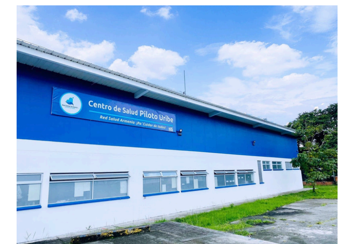
Centro de Salud Piloto Uribe