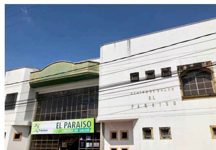
Centro de Salud El Paraíso